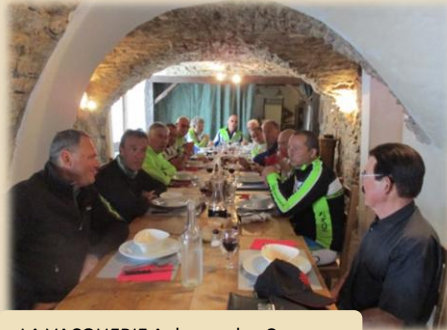
LA VACQUERIE Auberge des Causse

Arrivés au Caylar les deux groupes se rassemblent pour le contrôle près du célèbre arbre sculpté et c'est ensemble que nous nous dirigeons vers la Vacquerie St Martin lieu prévu pour le repas de midi.