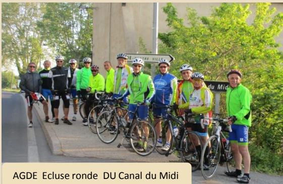
AGDE Ecluse ronde DU Canal du Midi

La transversale Cap d'Agde - Le Caylar , une des six proposées par le Codep34, était le choix du CC VIAS. Initialement prévue le 11 mai mais reportée en raison de pluies importantes.